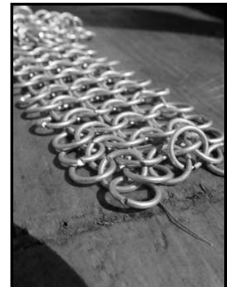
(Magiaceltica 2006 - Trentino)