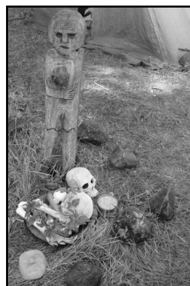
(Magiaceltica 2006 - Trentino)