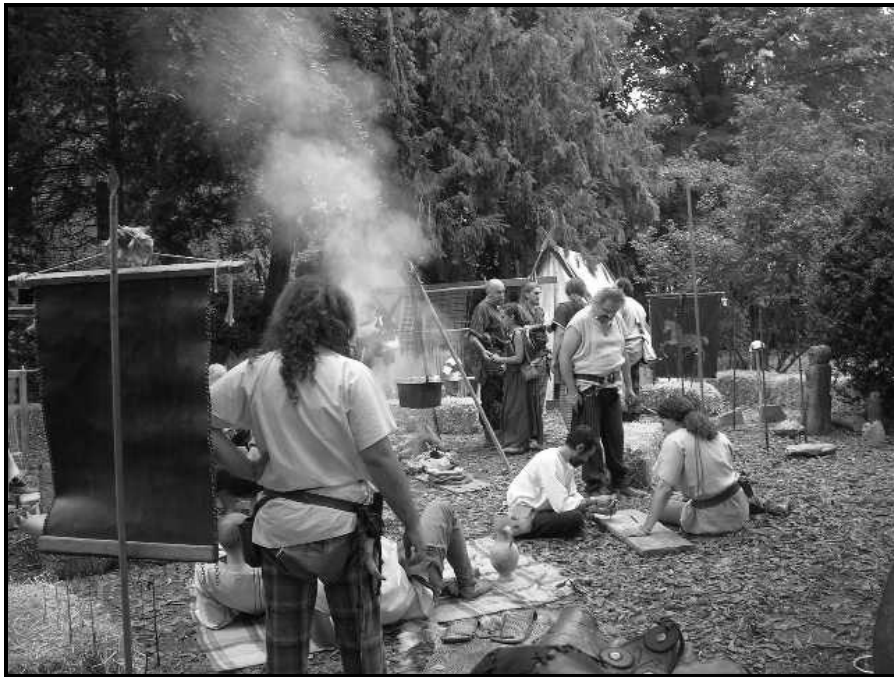
(Taurino Brigas 2006 - Pecetto Torinese)

Le nostre attività si suddividono tra pratiche (ricostruzione documentata di vestiario, armi, manufatti, cibi e bevande utilizzati nella rievocazione storica; partecipazione a feste e raduni celtici facendo vita da campo e prendendo parte a simulazioni di combattimento) e teoriche (conferenze, visite a mostre, articoli su riviste del settore).